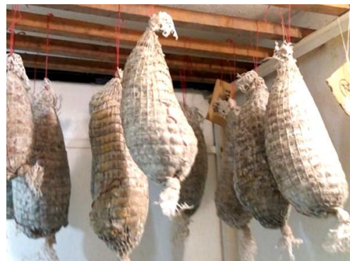
Judru en patois signifie joufflu.

Anticipations : ► Un second quadruple s'ouvre en ligne K.