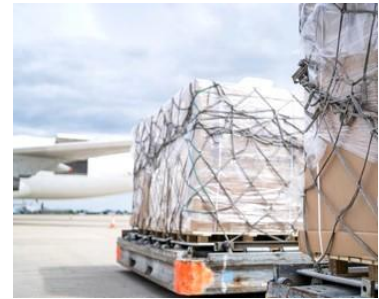
Dolly télécommandé d'aérop

Étymologiquement, le mot serait apparu dans l'armée américaine pour désigner ainsi familièrement un simple chariot, un support sur quatre roues qui servait juste à déplacer les charges lourdes. Avec le temps, le nom s'est répandu hors de l'armée, et le modèle a évolué en se modernisant, en s'adaptant aux besoins, et parfois en s'équipant d'un moteur, d'électronique, etc.