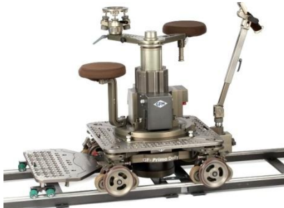
Dolly pour traveling, ici sur rail.